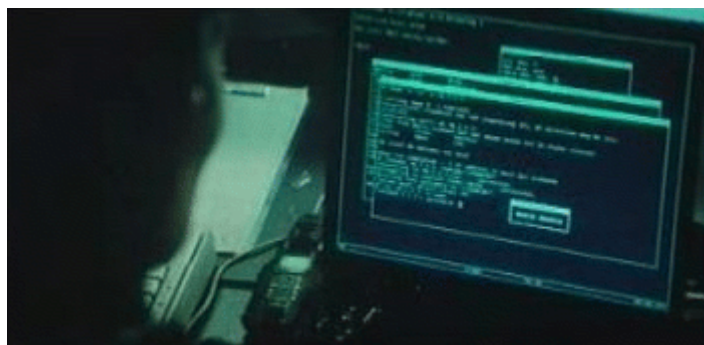
Gambar 1: Adegan pada saat menggunakan Nmap dalam film The Matrix : Reloaded

Dalam salah satu adegan menjelang akhir film The Matrix: Reloaded, Trinity membobol sistem komputer tenaga listrik darurat menggunakan salah satu tools yang sangat akrab di kalangan hacker: Nmap. Trinity adalah jagoan wanita hacker, yang diperankan Carrie-Ann Moss.