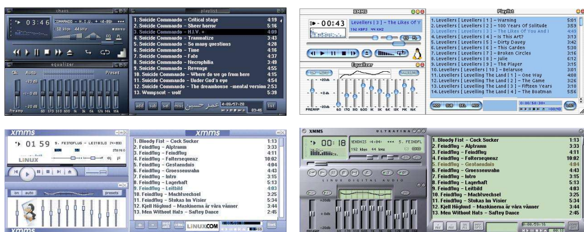
Gambar 1 Beberapa contoh skin XMMS

Masih sama dengan Winamp, XMMS memiliki 3 buah panel utama yaitu, panel kontrol, panel equalizer dan panel playlist . Kekompatibelan XMMS dengan tampilan Winamp membawa kabar gembira bagi pengguna Winamp yang ingin “menyematkan” skin (tampilan grafis dari suatu program yang dapat diubah-ubah) Winamp kesayangannya pada XMMS. Selain skin dari Winamp, telah tersedia pula banyak skin gratis di internet, yang dapat didownload dari http://www.xmms.org/skins.php .