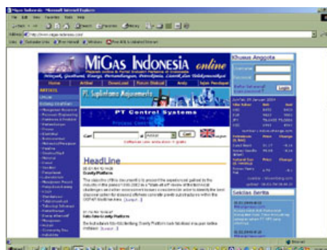
migas-indonesia.com, memberikan fasilitas pencarian artikel

Untuk sebagian orang yang tidak memiliki banyak waktu, menelusuri semua halaman situs untuk mencari informasi yang dibutuhkan bisa membuat mereka kesal, oleh sebab itu fasilitas pencarian akan sangat berarti bagi mereka. Dengan menyediakan fasilitas ini pada situs kita, maka pengunjung akan merasa nyaman dengan kemudahan mencari informasi yang dibutuhkannya.