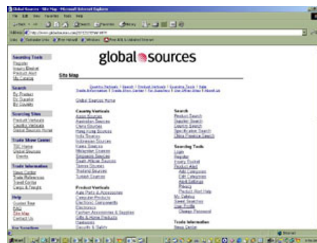
globalsources.com, melengkapi situsnya dengan sitemap

Site Map atau peta situs dapat memberikan gambaran singkat tetapi lengkap tentang keseluruhan isi situs, site map akan berguna sekali untuk scanning informasi yang dibutuhkan oleh pengunjung situs kita.